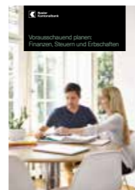
Vorausschauend planen: Finanzen, Steuern und Erbschaften