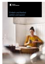
Einfach und flexibel zahlen und sparen

in jeder BKB-Filiale. Detaillierte Informationen über unsere Produkte und Dienstleistungen sowie sämtliche Konditionen finden Sie im Internet unter www.bkb.ch