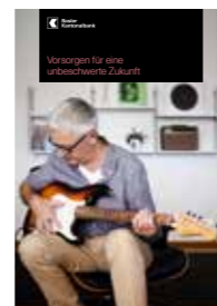
Vorsorgen für eine unbeschwerzte Zukunft