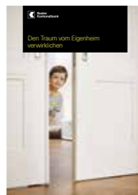
Den Traum vom Eigenheim verwirklichen