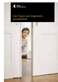
Den Traum vom Eigenheim verwirklichen