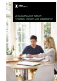
Vorausschauend planen: Finanzen, Steuern und Erbschaften