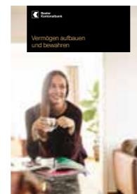
Vermögen aufbauen und bewahren