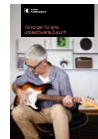
Vorsorgen für eine unbeschwerzte Zukunft